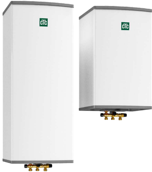
CTC Brilliant 60/ 110

Kombinationsventil KLK 15, Wandkonsole und Handbuch.