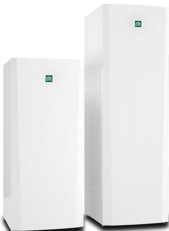
CTC Brilliant 200/ 300