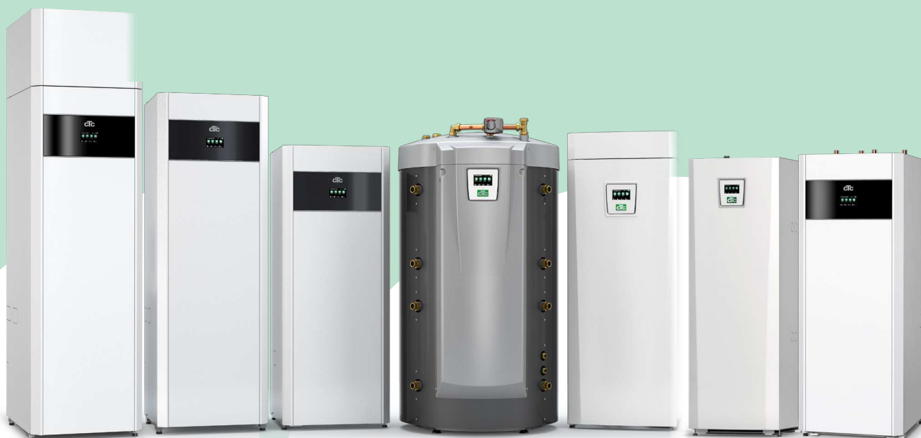
CTC EcoVent i360F

– ausführliche Informationen im entsprechenden Produktdatenblatt.